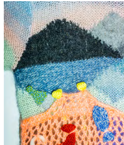
Front piece: Ribbing with knit through the back loop / Classic cable (rope and hawser) / Lace pattern (net) / Intarsia (water reflection) / Lice