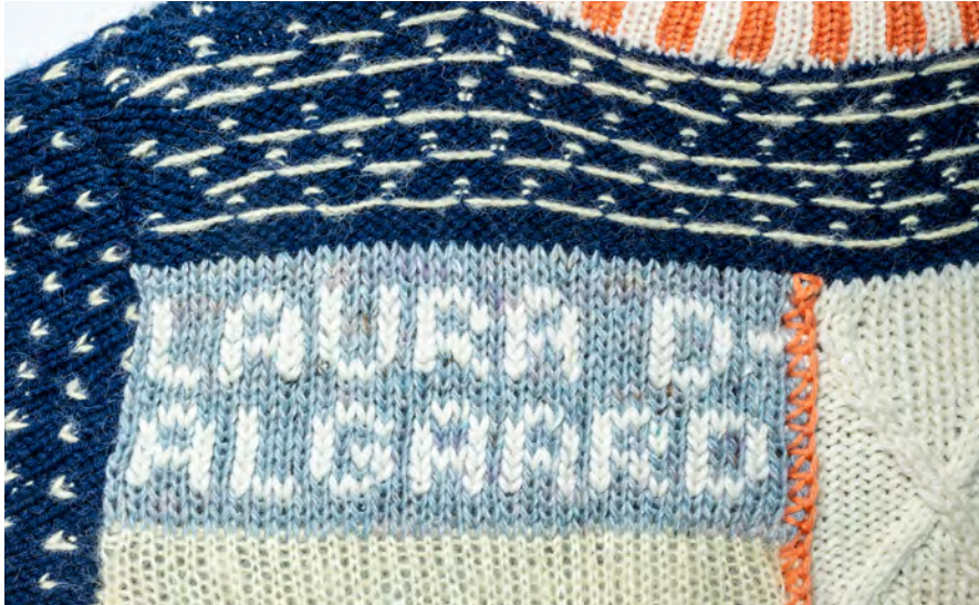
Caught in the Knit: Back piece