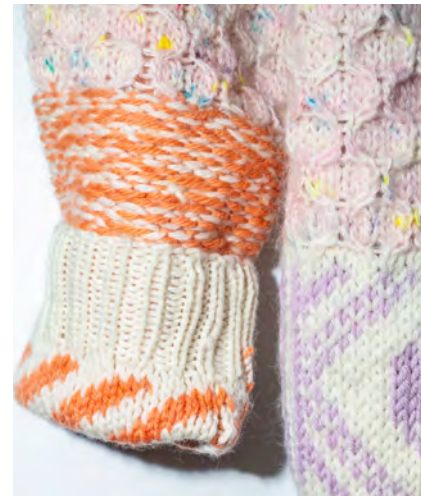
Left sleeve: Classic 1/k1 ribbing / Section of pattern from Halland knit (reversed) / Classic honeycomb cable / Lice stich