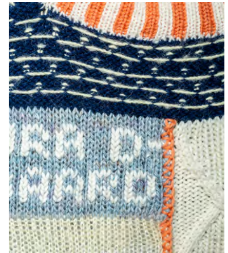
Back piece: Two-piece 2/2 rib / Classic OXO pattern (Fair Isle) / Blackberry / Sailor bubble stitch / Embroidered signature / Fade / Classic cable (the diamond) / Lice / Lice stich (reversed)