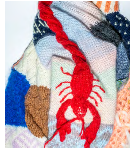
Right sleeve: Classic 1/k1 ribbing often used in Iceland / Section of Westcoast knit / Classic cable (rope and hawser) developed into a lobster.